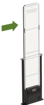
ARM-PC-EC-AR1 (Avec Sonnerie)